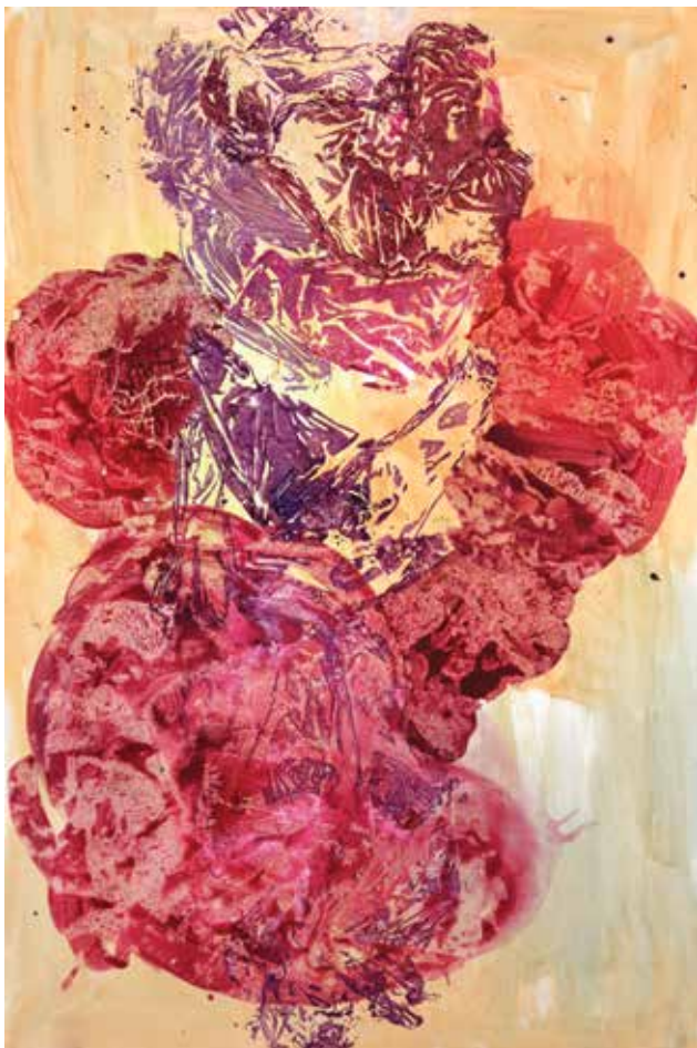
Bez naziva , 2017., 150x100 cm, akril na platnu