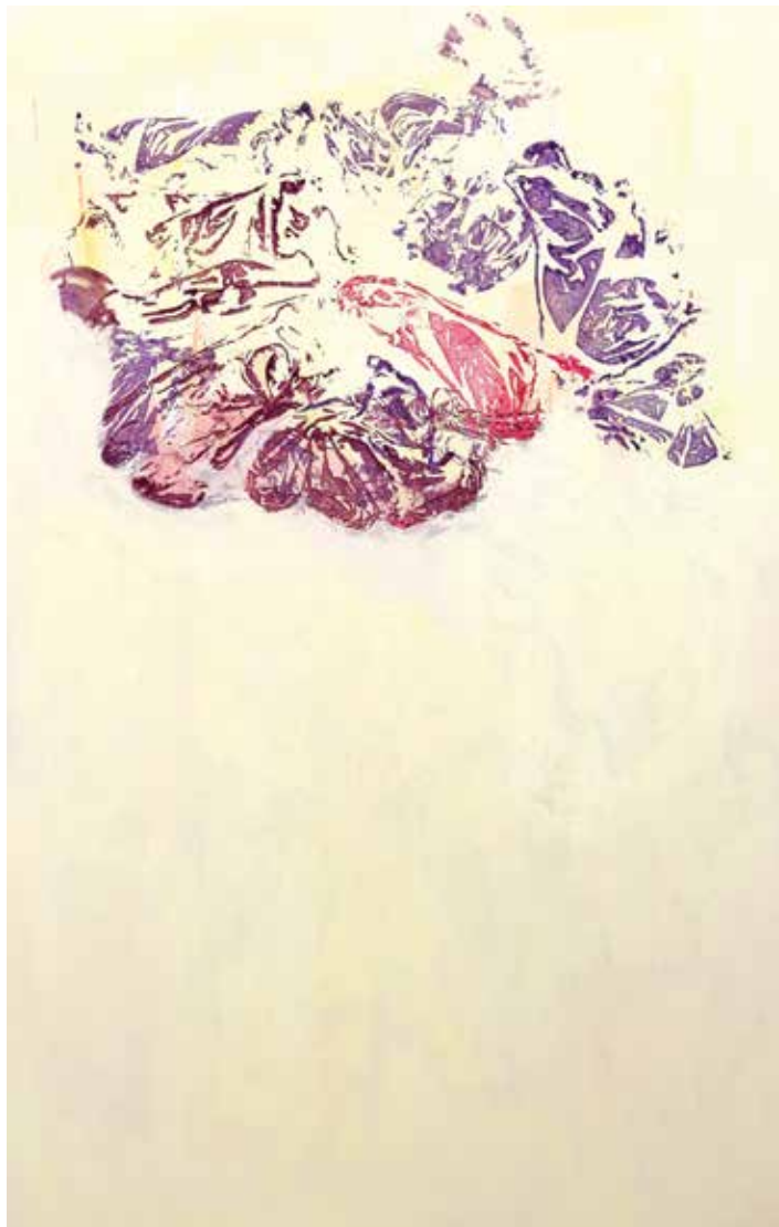
Bez naziva , 2017., 150x100 cm, akril na platnu

postojećeg. Zbog svega toga, ove slike zahtijevaju angažiranog, trezvenog gledatelja: spremnog na zagledavanje u mutnu površinu slike, na razabiranje višestruko preklapljenih slojeva, na toleriranje nejasnoća i prividnih nelogičnosti – ukratko, gledatelja koji se ne odaje lako ni sanjarenju niti očajanju.