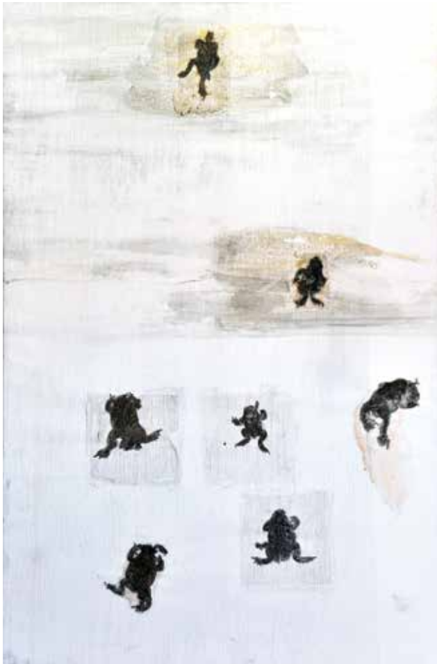
Gordana Kovačić, Zapis sa žabama, 2013.